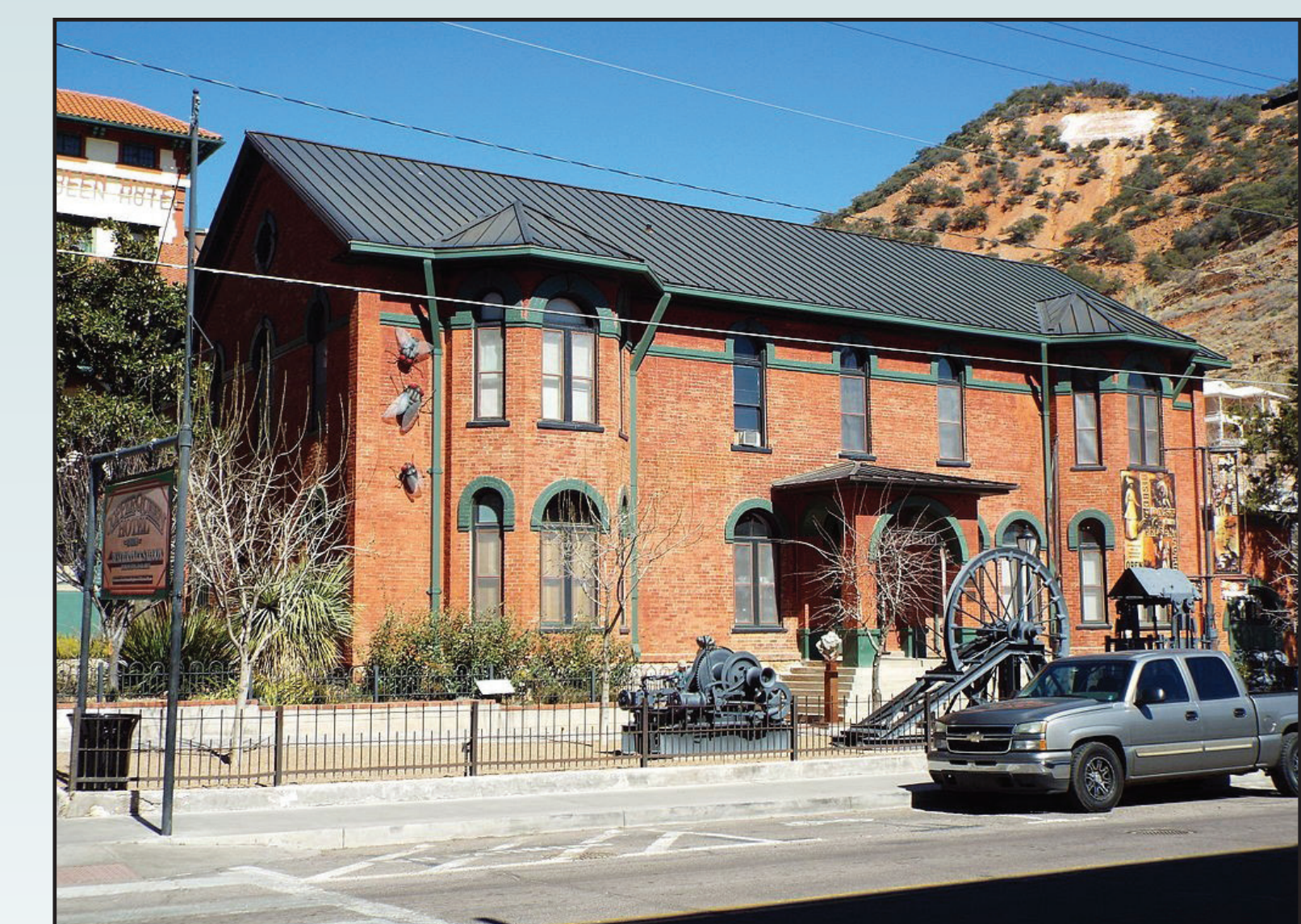
The Phelps Dodge Headquarters Building.