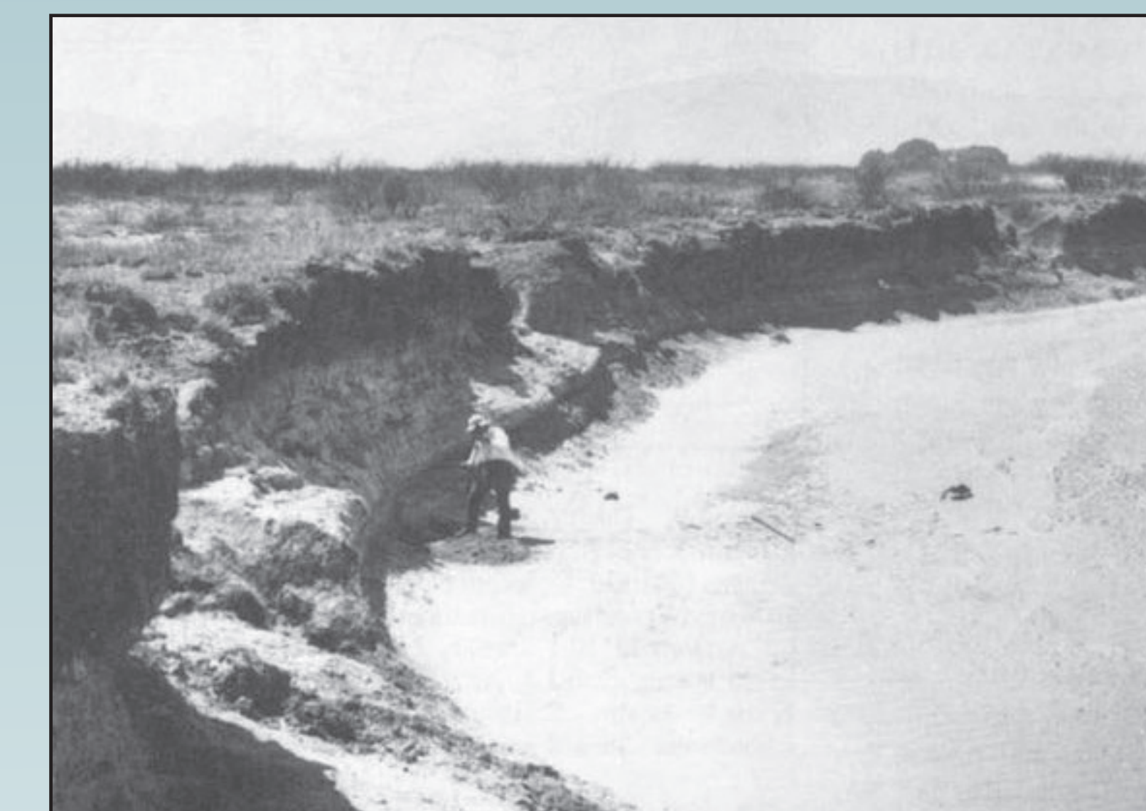
Double Adobe site area in 1936.