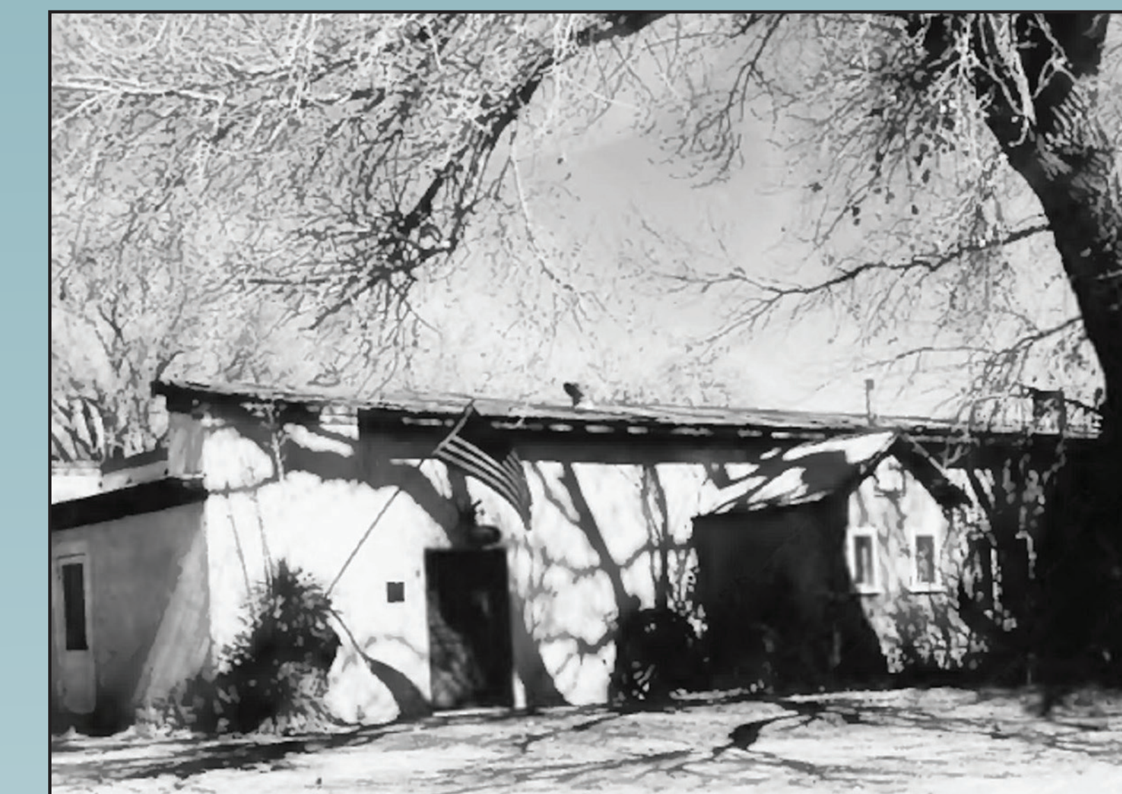
Sierra Bonita Ranch.

Paralelamente al proceso NEPA, La Fuerza Aérea está llevando a cabo la participación pública requerida para la consulta de la la Sección 106 de la NHPA para los efectos que pueden afectar a las propiedades históricas.